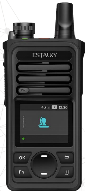
Rádio comunicador E120